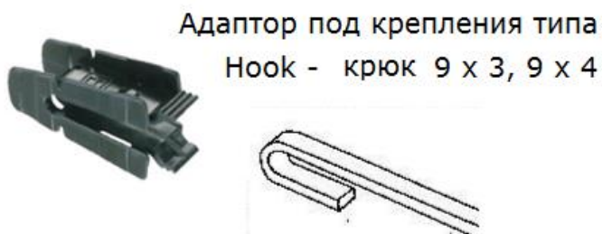
Адаптор под крепления типа Hook - крюк 9 x 3, 9 x 4