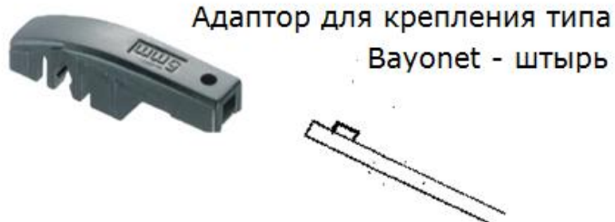
Адаптор для крепления типа Bayonet - штырь

Для размеров 11" = 280 мм до 14" = 350 мм